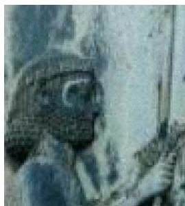
(الف) روش بزرگنمایی Replication